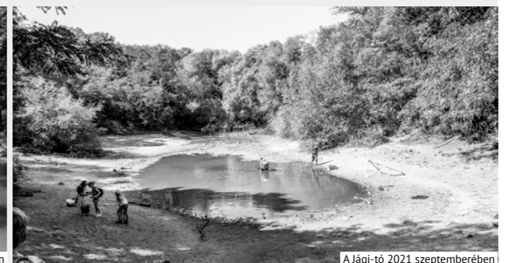
A Jági-tó 2021 szeptemberében