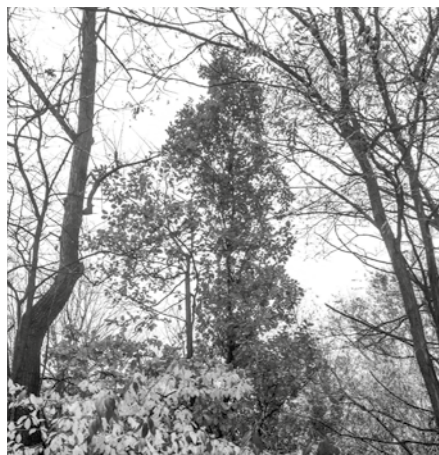
Alászorult tölgy a Slötyi mellett (2021)

csán a törzs valamely keresztmetszeten jelentős törésveszéllyel bír,