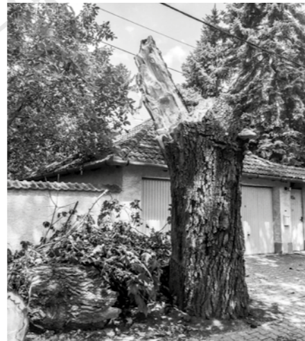
Akusztikus tomográffal bevizsgált, vágásra ítélt, de nem kivágott fa kettőtört (2021, nem Szentiván)

Januárban 4 nagy méretű, élet- és balesetveszélyes nyárfa kivágására kerül sor a Slötyi-tó körül, illetve a tűzoltóság pavilonja mellett. A faegyedek mindegyike fokozottan balesetveszélyes volt. 32