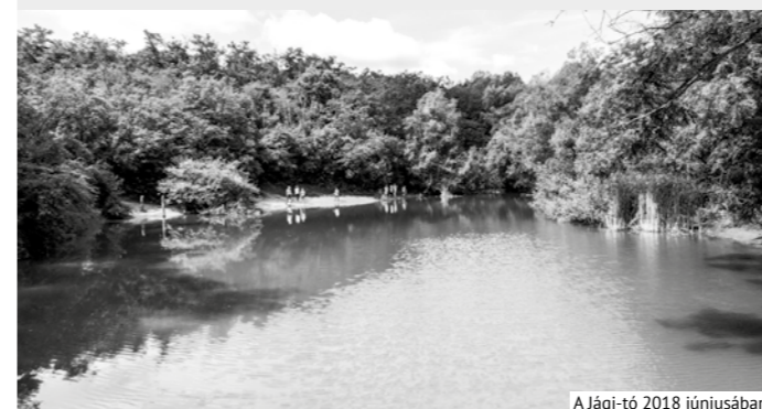
A Jági-tó 2018 júniusában

A Jági-tónak hosszú évek óta nincs tápláló forrása, csak a csapadékvíz töltögeti. Illetve töltögetné... Ám két-három