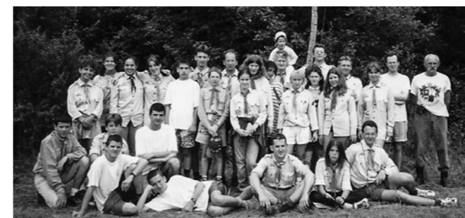
1997. július 14–24., Cserhátszentiván