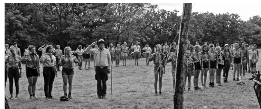
2020. július 10–19., cserkész tábor, Csákvár

944. számú Szent Borbála Cserkészcsapat néven kaptuk meg működési engedélyünket a Magyar Cserkészszövetségtől. A névválasztást a falu bányászmultra iránti tisztelet ihlette. Gyerekszivajtól lett hangos a környék, amikor az első toborzás