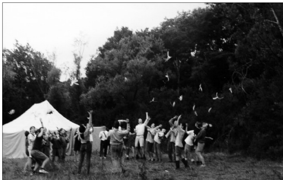
1997. július 14–24., Cserhátszentiván