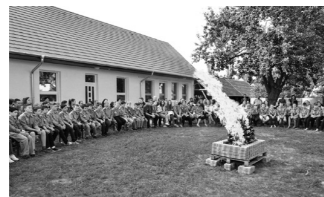
2015. június 21., évvzáró táborúzt, ígérttételel