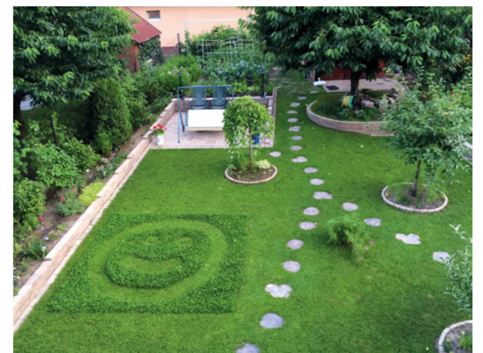
Így is kinézhet egy fenntartható, alternatív módszerekkel művelt kert