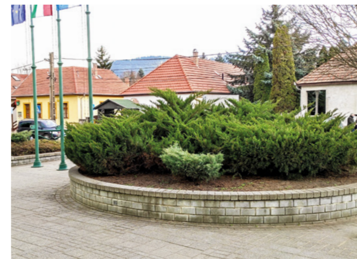
Szépül a zöldsziget