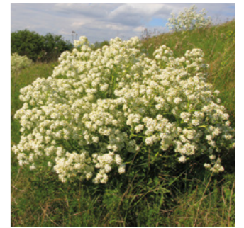
Tátorján, fotó: Klébert Antal