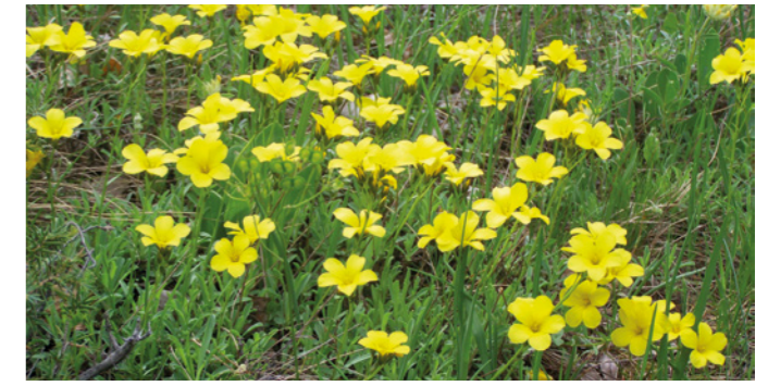
Pisili len, fotó: DINPI

Ez az elnyert uniós pályázat egészen 2027 elejéig tart, így Pilisszentiván lakói is tapasztalni fogják a település határában húzódó természeti területen folyó fekete-fenyő-kitermeléseket, ültetési munkálatokat, kutatási tevékenységet. Kérjük a kedves lakosokat, mindenki fokozottan figyeljen a védett területre vonatkozó szabályok betartására, hogy még hosszú generációkon keresztül gyönyörködhessünk a pilisi len virágzásában, mely településünk egyik legnagyobb kincse, és amelynek fennmaradása elsősorban rajtunk múlik.