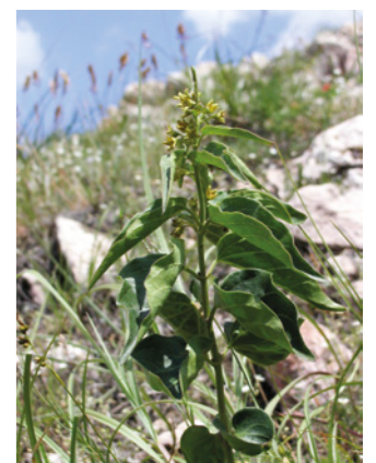
Magyar méreggyilok, fotó: DINPI