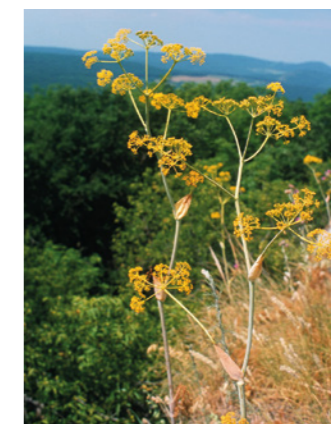
Magyarföldi husáng