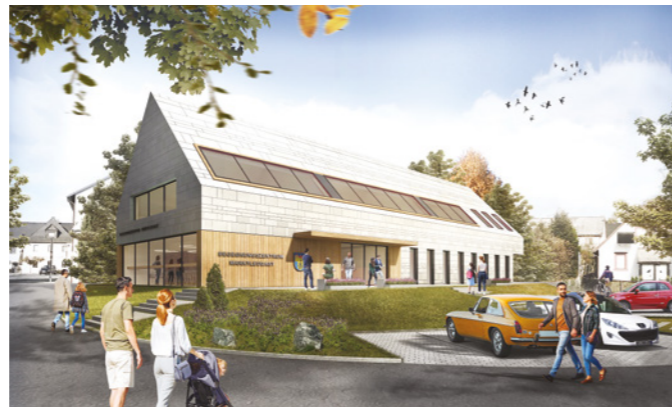
A projekt háromdimenziós megjelenítése: Marktleugasti találkozóközpont, „júli” építésziroda, Kulmbach

Timo Heß, a kulmbachi juli architektura+design építésziroda tulajdonosa a marktleugasti képviselő-testület ülésén bemutatta annak a találkozóközpontnak és orvosi rendelőnek a terveit, melyet a közeljövőben szeretnének megvalósítani. A projekt költsége előreláthatólag 2,536 millió euró, melynek 73,2%-a a találkozóközpont létrehozásához szükséges, 26,8%-a az orvosi rendelőhöz kell, és ehhez jön még 180 000 euró a kültéri létesítmények költségére. Az épület hasznos alapterülete 734 m 2 . A földszinten külön bejáratokon keresztül lehet majd megközelíteni az orvosi rendelőt és a könyvtárat, a találkozóközpont az emeletre kerül, és minden helyiség akadálymentesen elérhető lesz a Münchberger Straße felől.