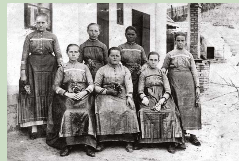
Barátnők szentiváni népviseletben az 1910-es évekből.