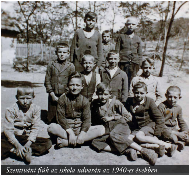
Szentiváni fiúk az iskola udvarán az 1940-es években.