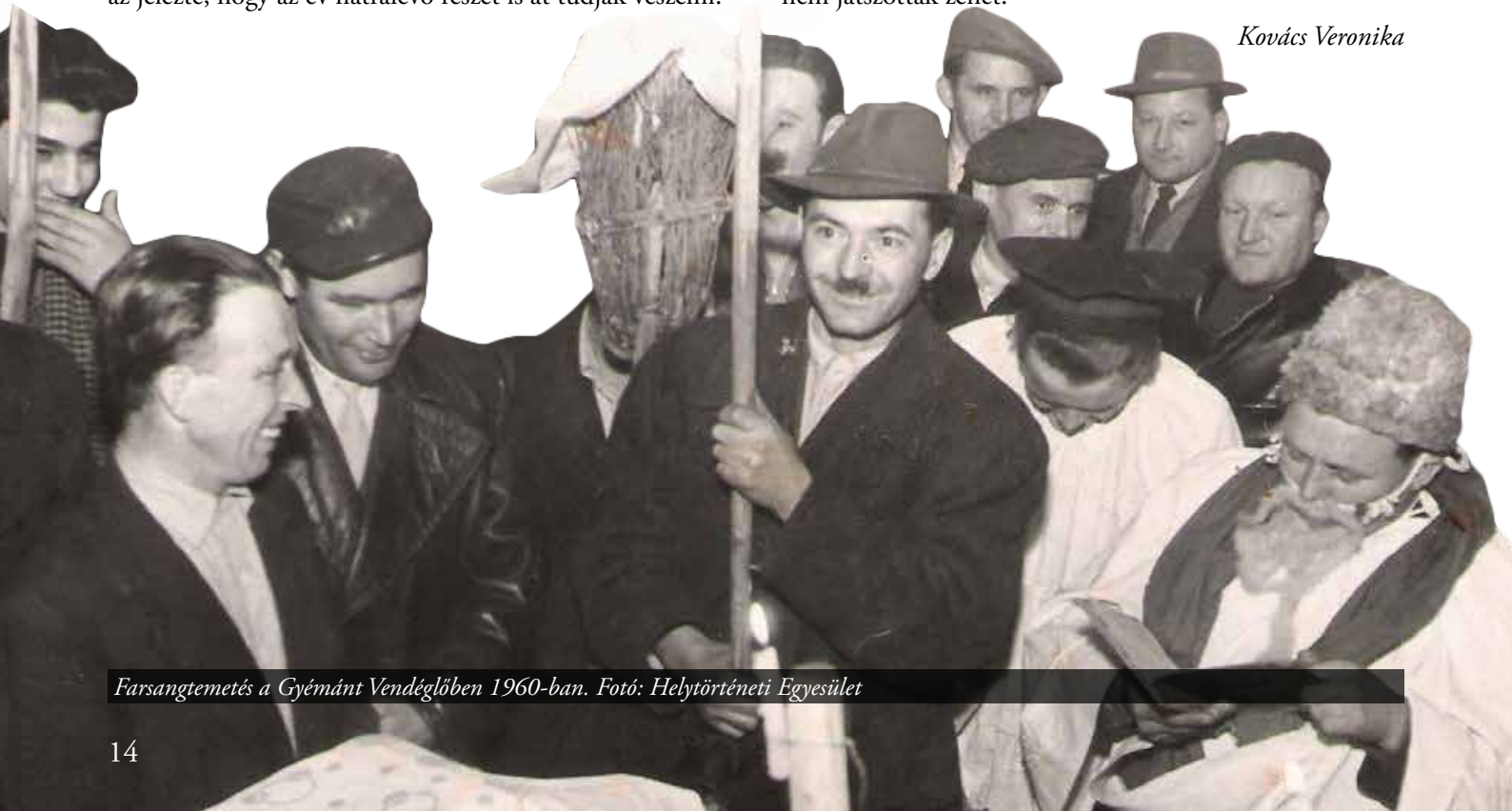
Farsangtemetés a Gyémánt Vendéglőben 1960-ban.