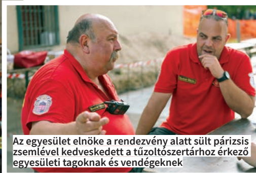
Az egyesület elnöke a rendezvény alatt sült párizsi zsemével kedveskedett a tűzoltószertházhoz érkező egyesületi tagoknak és vendégeknek

2001-ben Gulácson, a nagy tiszai árvíznél reggeltől estig dolgoztak, ez még is kedves emlék számukra, olyan csapat