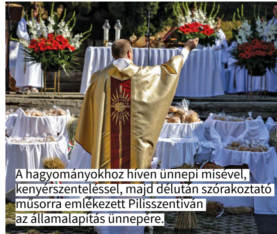
A hagyományokhoz híven ünnepi misével, kenyérszenteléssel, majd délután szórakoztató műsorra emlékezett Pilisszentiván az államalapítás ünnepére.